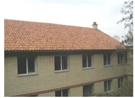
Покривање зграде интерната и деканата – јесен 2007.