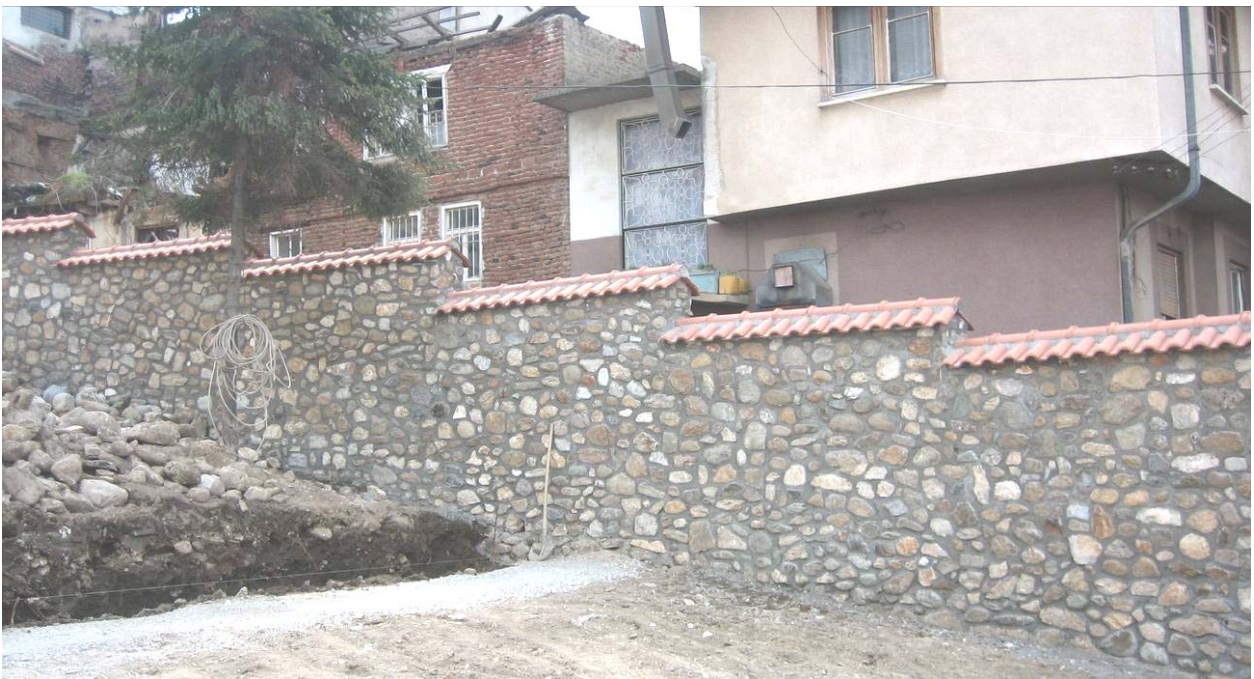
Нови камени оградни зид око комплекса Богословије