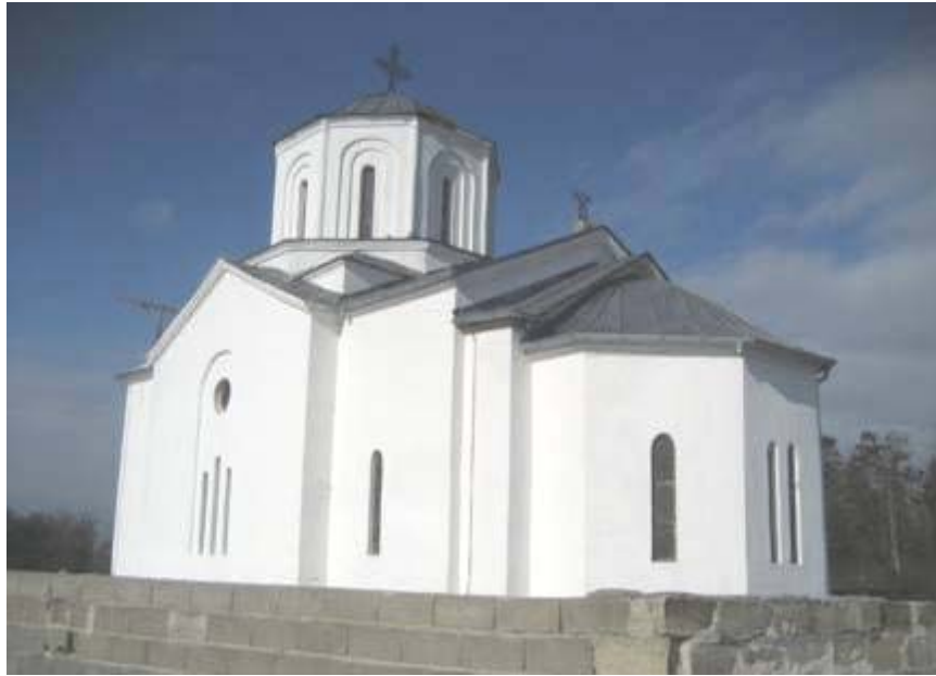
Изглед цркве након друге фазе обнове, децембар 2007. год.

Унутрашњост цркве је најпре потпуно очишћена. Оштећени малтер је комплетно одстрањен укључујући и један преостали део са фрескама, које су неповратно уништене. Након тога, сви унутрашњи зидови и сводови су поново омалтерисани. Зидови апсиде, поново изграђени 2006. године су омалтерисани, споља и изнутра. Електрична инсталација је комплетно обновљена. Нови прикључак до градске мреже је обезбеђен постављањем бандера и ваздушних каблова. Постављена је и нова часна трпеза урађена од мермера. Пројекат за под је урађен као комбинација мермерних плоча у две различите боје. Споља су зидови консолидовани и окречени, кров је на местима где је покривач био оштећен или је недостајао комплетно поправљен оловним таблама. Гвоздени крст је направљен и постављен на куполу цркве.