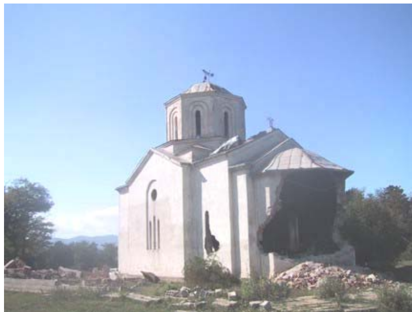
Изглед цркве у лето 2004. год. пре почетка