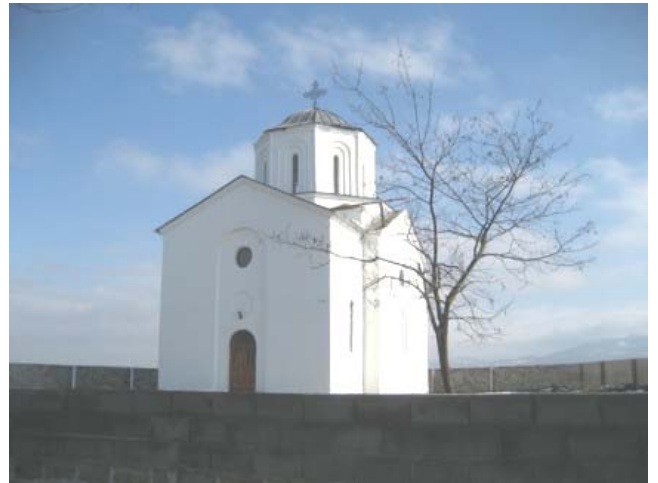
Поређење: црква након уништења 2004. и крајем 2007. године