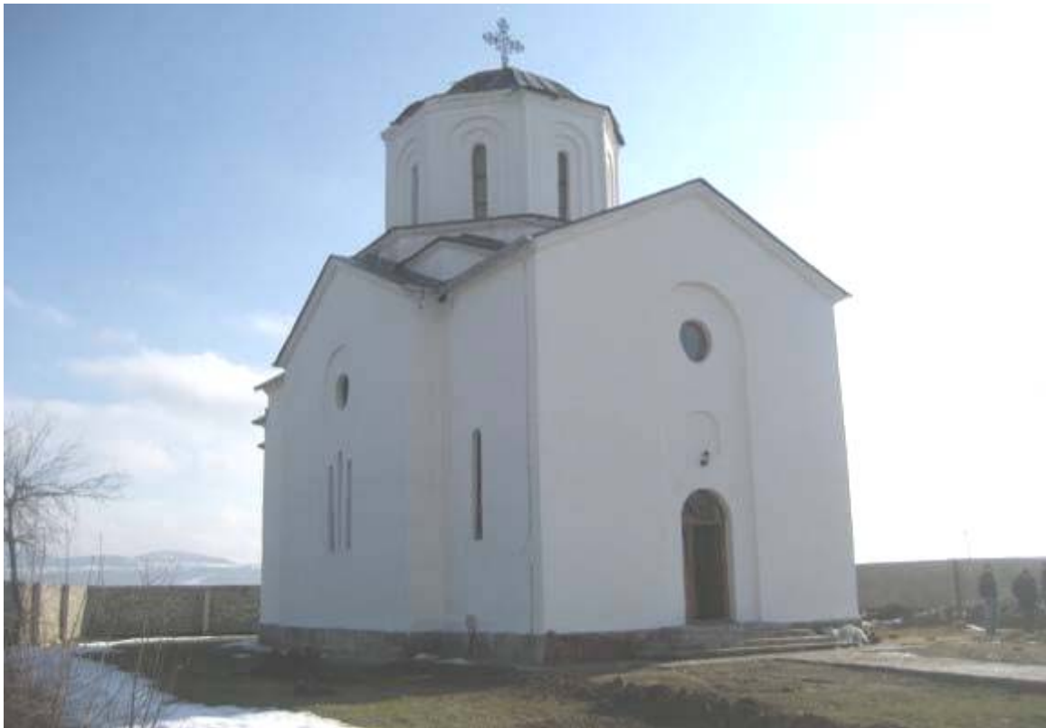
Изглед цркве Св. Апостола Андреја након друге фазе обнове крајем 2007. год.

Детаљна обнова цркве је почела у лето 2007. и састојала се од унутрашњих и спољашњих поправки. До краја године већи део радова у цркви је завршен. Друга интервенција обухвата обнову звоника и она је започета у касну јесен 2007. год. Радови на звонику је предвиђено да буду завршени у току 2008. када ће бити комплетирани и унутрашњи радови у цркви.