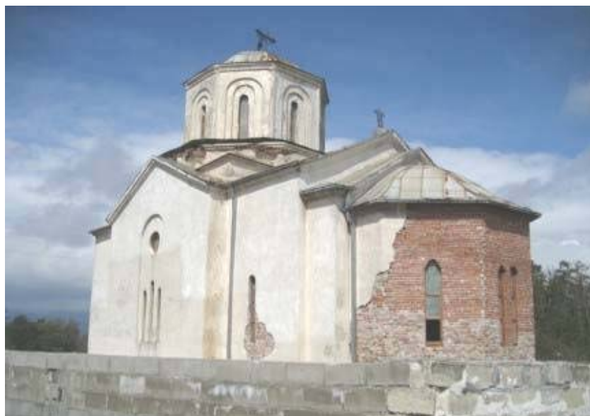
Прва фаза радова на консолидацији и поправци апсиде 2005-2006. год.