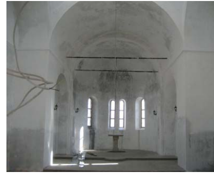
Радови у унутрашњости храма од 2004 до 2007. Крајем 2007. зидови су омалтерисани и предстоје финији и детаљнији радови у унутрашњости храма у току 2008. године.