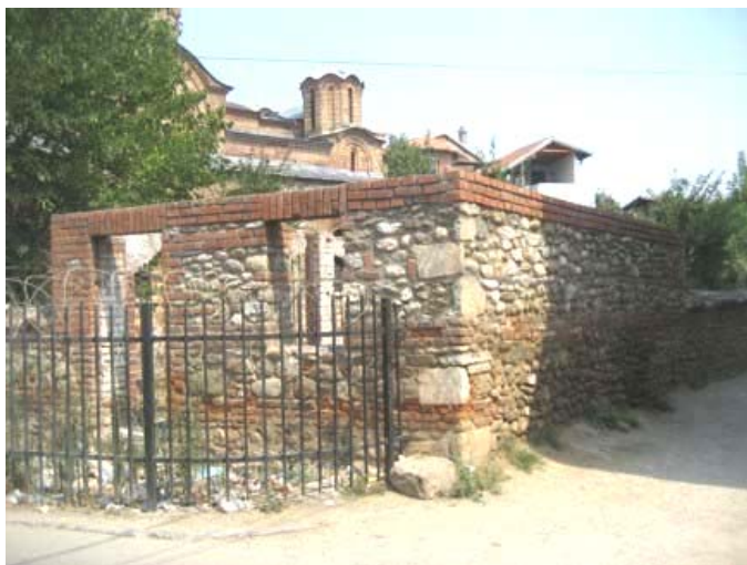
Изглед помоћне зграде пре обнове

Након паљења зграде 2004. год. само су остали камени зидови помоћне зграде док је све остало комплетно било уништено ватром. Након чишћења шута и зидова, изграђена је нова дрвена кровна конструкција која је покривена црепом. Зидови су измалтерисани и окречени, подови обложени керамичким плочицама и уградња нових дрвених врата и прозора је комплетирана. У згради је уведена струја, вода, канализација са санитарним елементима у тоалету и кухињска опрема.