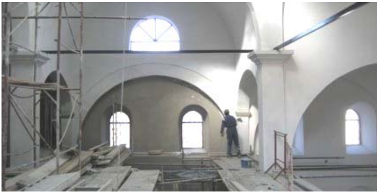
Унутрашњи радови, саборни храм Св. Ђорђа - Призрен

У току 2007. Године КСО је радила на припреми спровођења пројекта везаног за рестаурацију фресака, обнову иконостаса и израду икона. Ови радови су предвиђени за 2008. годину и то посебно на оним локацијама где већ постоји литургијски живот или где је у могућности да се обнови у краћем року. У септембру месецу КСО је обавио разговоре са кандидатима и проценио њихов ниво стручности и интересовања. На разговорима су учествовале поједине манастирске радионице из разних делова Србије које се баве иконописом и дуборезом. На основу ових разговора сачињен је предлог стратегије за имплементацију који ће бити усвојен у току 2008. године.