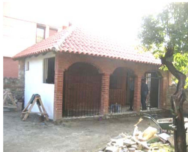
Изглед помоћне зграде после обнове

Крајем 2007. је уговорена трећа фаза замене оловног покривача на крову цркве. Површине на којима се интервенише су на челу, централном броду, централној куполи и на мањим куполама. Постојећи оловни покривач је тешко оштећен док су неке површине покривене кородираним поцинкованим лимом. Уговором су такође предвиђене неопходне поправке око 24м 2 оловног покривача након крађе олова на тој површини крова у јесен 2007. год.