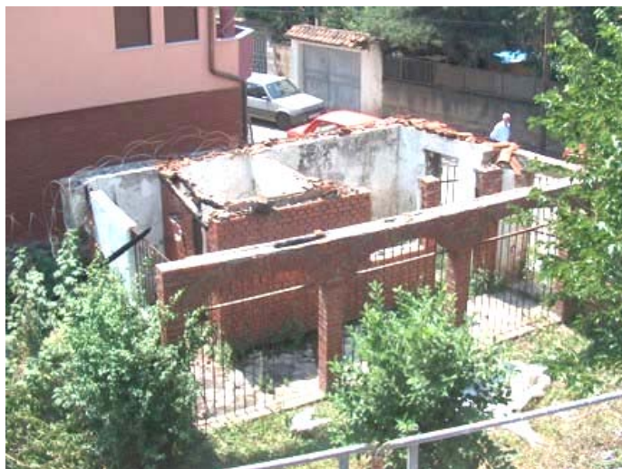
Изглед помоћне зграде пре обнове