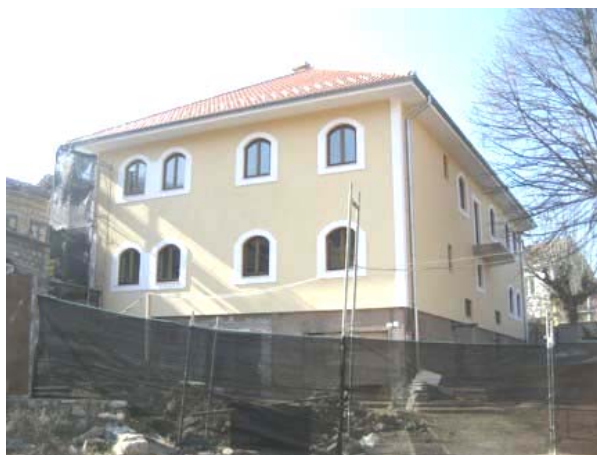
Владичански двор, Призрен