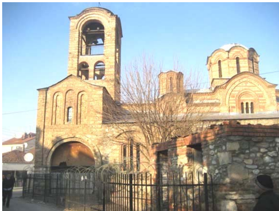
Црква Богородице Љевишке, Призрен

Храм Богородице Љевишке у Призрену је објекат огромне културне вредности и уврштен је на листу Светске културне баштине УНЕСКО.