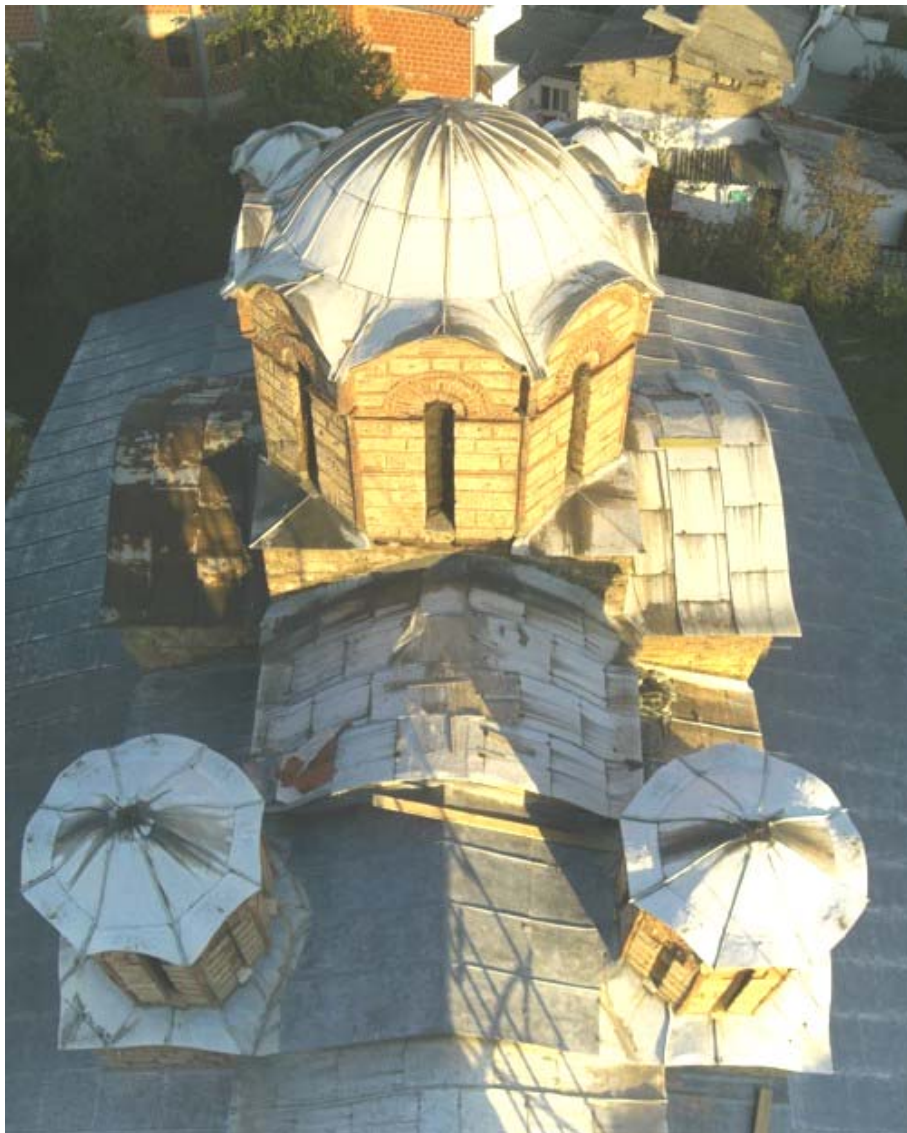
Почетно стање оловног покривача над централним бродом (у претходним интервенцијама рађено је покривање бочних бродова)