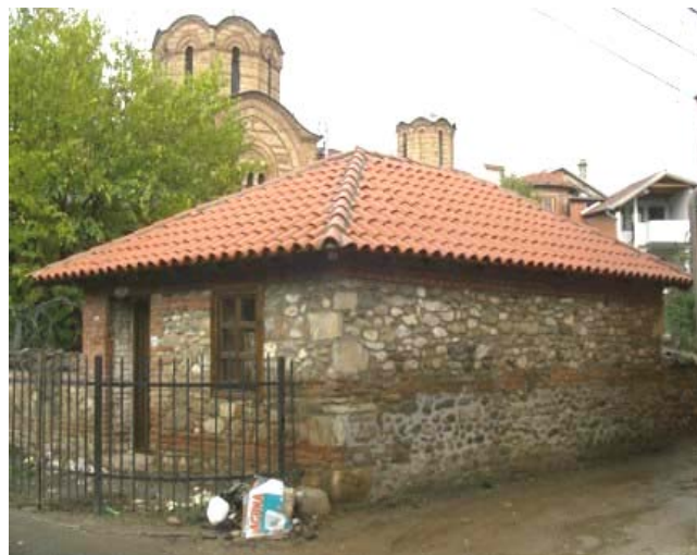
Изглед помоћне зграде после обнове