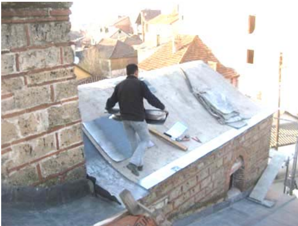
Радови на покривању оловним таблама – Богородица Љевишка