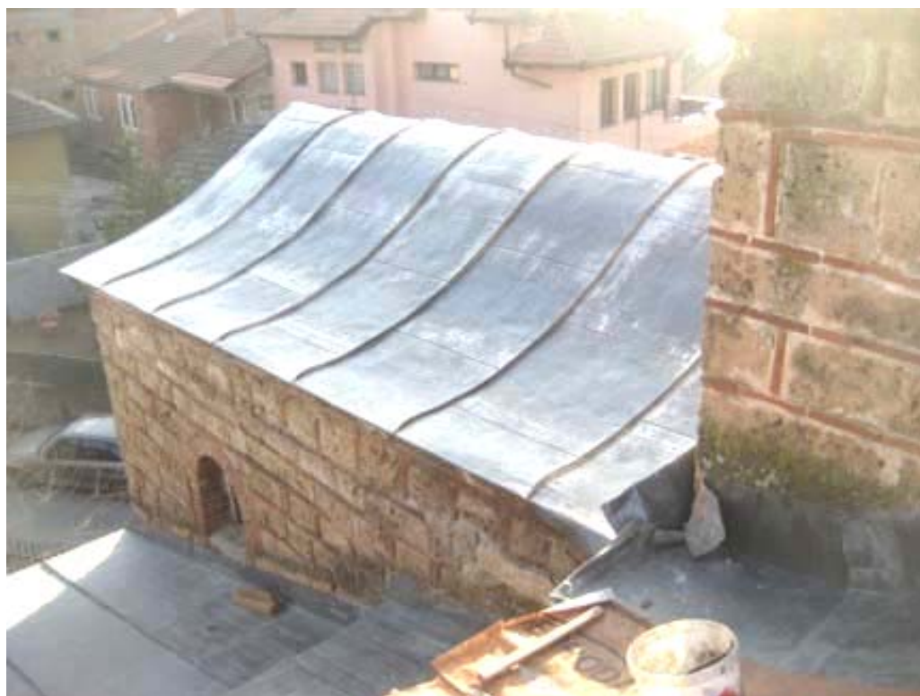
Новопостављени оловни покривач – завршени радови – Богородица Љевишка