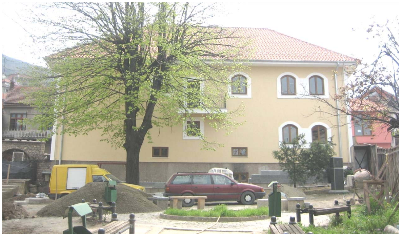
Северна фасада обновљеног Владичанског двора у Призрену, април 2008.