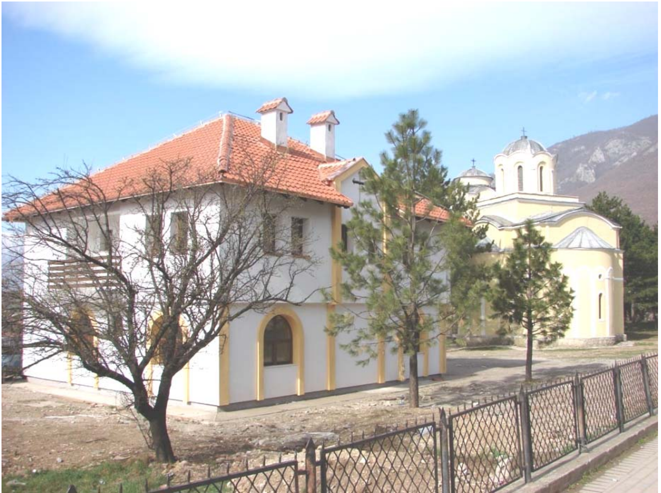
Храм Св. Апостола Петра и Павла са парохијским домом, Исток