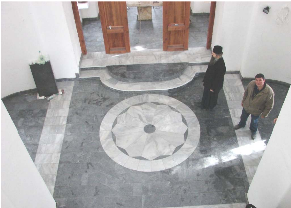
Нови мермерни под у обновљеном храму Св. Апостола Петра и Павла у Истоку, фебруар 2008.

Такође, неке критике да обнова која се врши у сарадњи са косовском страном под Комисијом Савета Европе наводно води ка губитку идентитета наших светиња, очигледно представљају замену теза. Управо држање светиња у рушевинама и нерад на њиховој обнови послужио би том губитку, а добро је познато да су услови за другачији начин обнове на већински албанским територијама Косова веома тешки, ако не и потпуно немогући. Стога се у обнови стално наглашава српски православни карактер светиња и у том процесу косовска страна осим новчане подршке тј. надокнаде почињене штете и логистичке помоћи у комуникацији са општинама, нема никакву стручну или било какву другу ингеренцију.