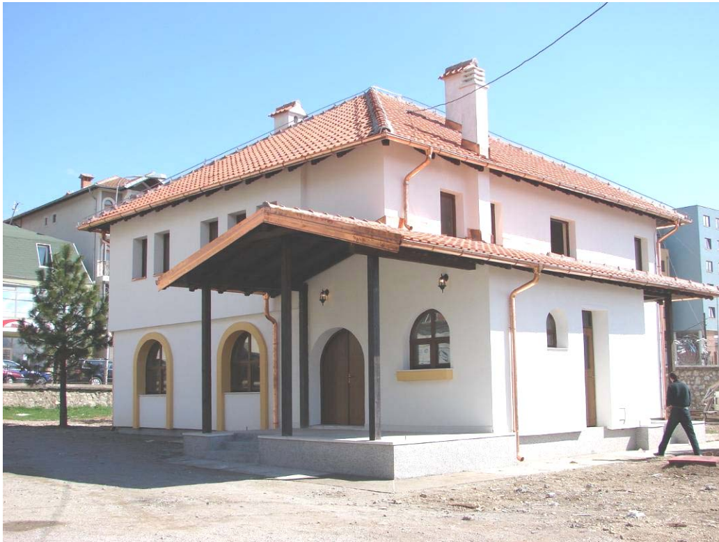
Обновљени парохијски дом у Истоку, март 2008.