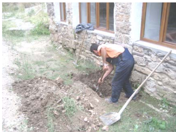
Пробни ров код спољашњег зида