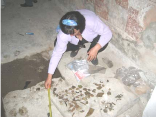
Пронађени археолошки фрагменти у цркви

Археолошко истраживање старе цркве Св. Ђорђа је обављено у септембру 2007. године. Истраживања су вршена у складу са археолошком стратегијом одобреном од стране Завода за заштиту споменика културе Србије, а обавили су их КСО археолози из ЗЗС у Лепосавићу и Призрену као и стручњак из Међународног одбора експерата (МОЕ).