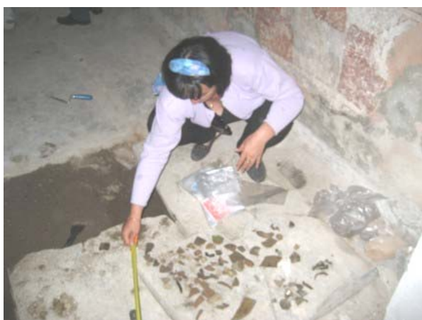
Пронађени археолошки фрагменти у цркви

Археолошко истраживање старе цркве Св. Ђорђа је обављено у септембру 2007. године. Истраживања су вршена у складу са археолошком стратегијом одобреном од стране Завода за заштиту споменика културе Србије, а обавили су их КСО археолози из ЗЗС у Лепосавићу и Призрену као и стручњак из Међународног одбора експерата (МОЕ).