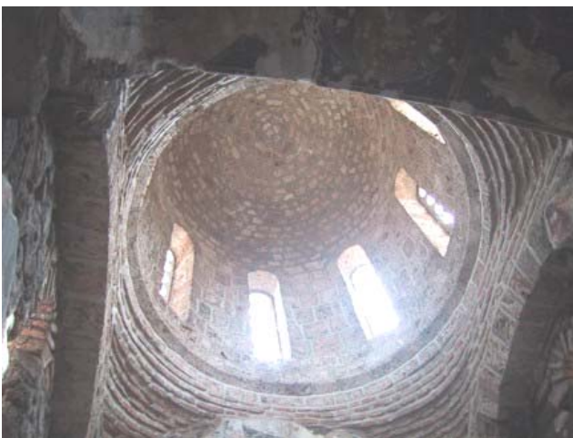
Почетно стање унутрашњости куполе