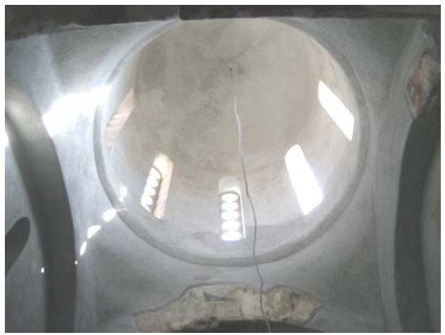
Купола након конзерваторских радова